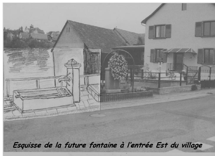
Esquisse de la future fontaine à l'entrée Est du village